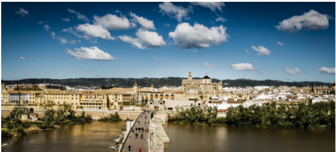
Panorámica Skyline José Carlos Muñoz García

Córdoba es célebre por ofrecer una gastronomía de altísima calidad, con platos universalmente extendidos como el salmorejo, el flamenquín o el rabo de toro. Las históricas tabernas cordobesas son templos de tertulia y disfrute del buen vino de Montilla-Moriles, el perfecto acompañante de las excepcionales recetas de la gastronomía cordobesa.